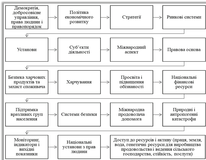
Рис. 1.3 – Добровільні керівні принципи Ради FAO Джерело: за даними [52]