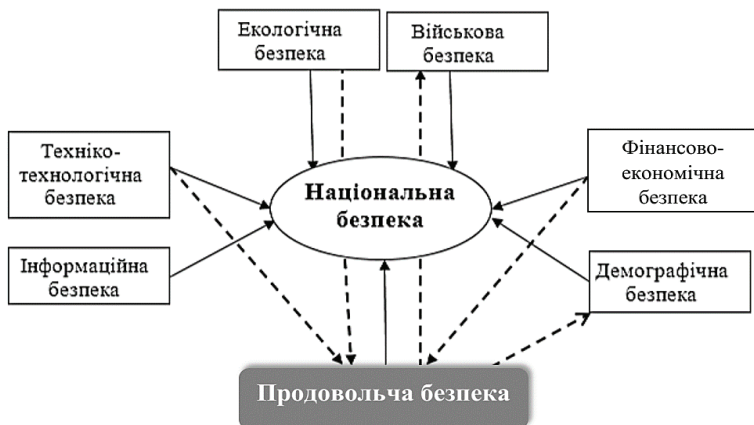
Рис.1.1 – Продовольча безпека в системі національної безпеки

Взаємозв'язок і взаємообумовленість між стратегічними елементами системи національної безпеки країни схематично представлено на рис.1.1.